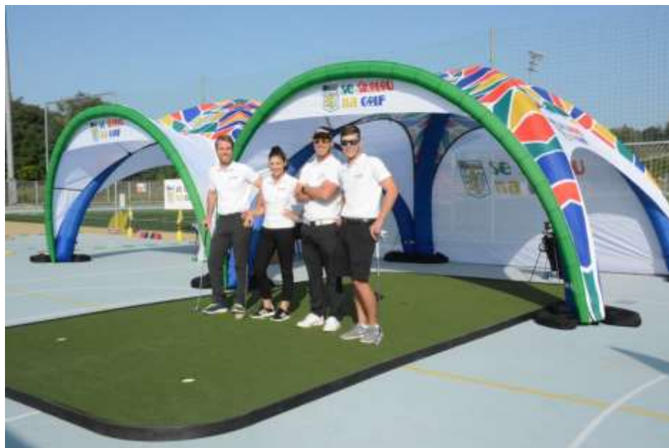
Nafukovací stany X-GLOO a puttovací koberec

Nové vybavení prezentované v rámci OVOV (odznak všestrannosti - projekt ČOV) v září