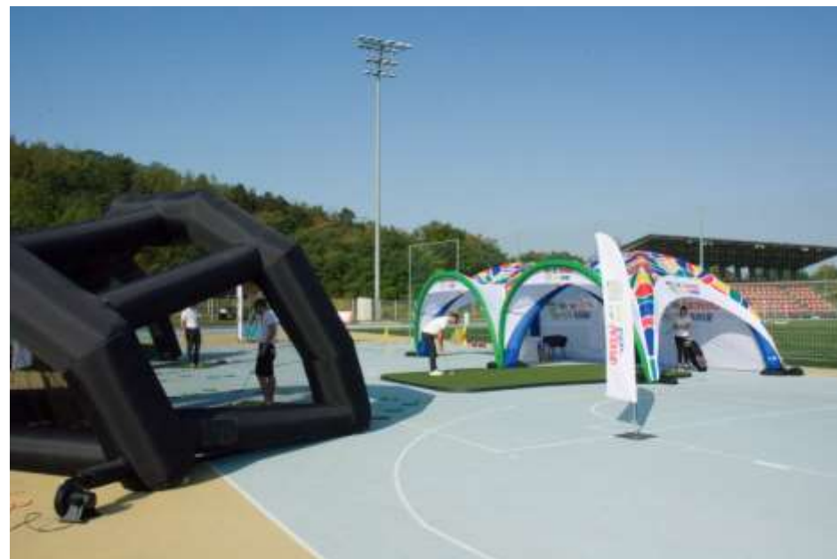
Odpalovací nafukovací oblouky jsou prozatím řešeny zápujčkou