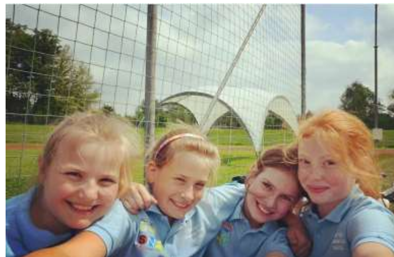
Vítězná fotografie v soutěži na sociální síti Facebook