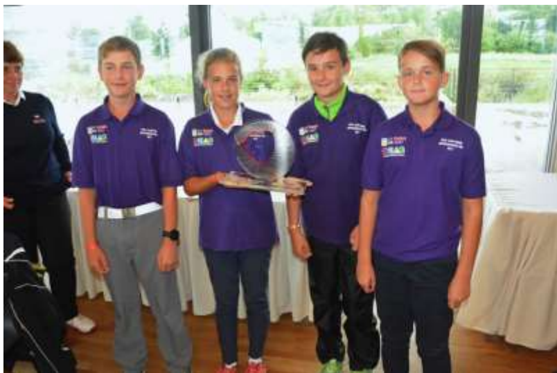
Celkovým vítězem se stalo družstvo kroužku při Golf Clubu Praha.

Finálové utkání se uskutečnilo v pátečním turnajovém dni na D + D Real Czech Masters a zúčastnilo se ho 6 nejlepších družstev.