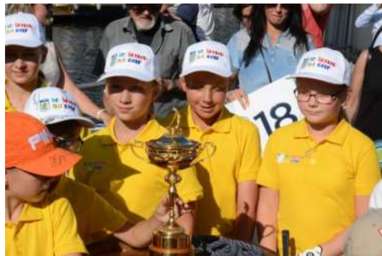
8 golfových klubů vyslalo své zástupce na exhibice v rámci D + D Real Czech Masters