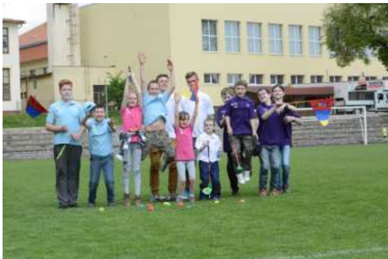
Jarní kvalifikační kolo v Třešti